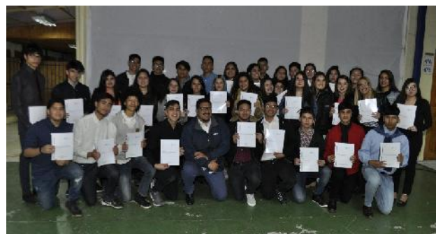
IV° Año Medio “B”