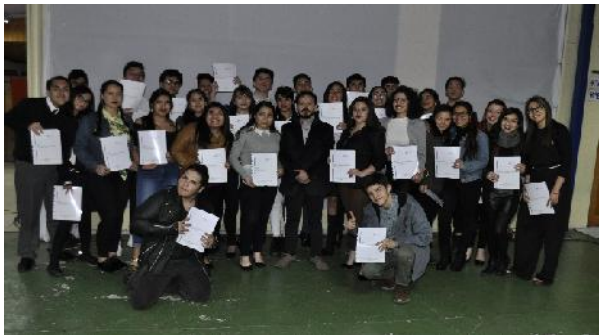
IV° Año Medio “A”

En el año 2019 junto con el diagnóstico a los estudiantes de 4° Medio 2019, se adelantó el proceso para los estudiantes de 4° Medio 2020, aplicándose los test en Tercer Año Medio, con el objetivo de contar para ellos con la Carpeta de Diagnóstico Vocacional en el mes de marzo 2020 y de esta forma adelantar el proceso de orientación y acompañamiento vocacional.